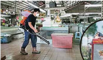
巴刹人流最多，必須進行消毒工作，以遏止病毒擴散。小圖為萬宜志願消防隊在錫米山新村範圍噴洒消毒水殺菌。

(加影26日訊)繼蕉賴11英里新村於昨日展開消毒工作後，加影錫米山新村包括巴刹也在今日進行全面消毒防疫，巴刹攤販為配合消毒工作亦提早打烊。為監控巴刹人流，小販公會今起實施民眾領牌買菜。