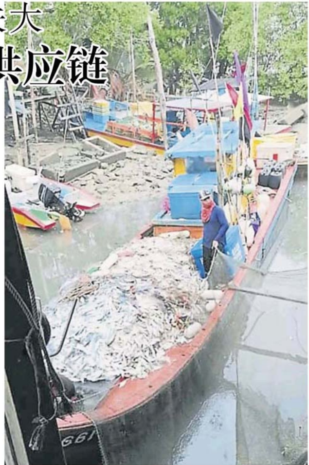
渔夫捕获大量鱼获却无处可销售，只好“纵鱼归海”。

令期间购买渔夫所剩余的鱼获，这措施将可保证国家粮供安全，同时渔业发展局也可实施该计划，可更快速将鱼获推上市场。”