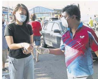
锡米山巴刹星期四提早关闭, 以展开消毒工作。

他说, 除了领牌买菜, 他们已在巴刹外面划线, 顾客需站在线内等候, 及准备洗手液让顾客涂手, 每天要用到 7 瓶洗手液, 费用由公会承担。