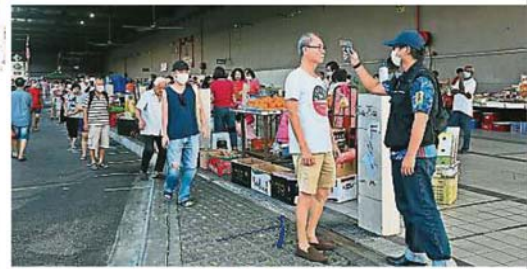
民眾在進入巴刹前必須測量體溫及洗手, 做好防疫措施。

他表示, 他會就此事和八打再也市政府做出商討, 若獲得當局的批准, 屆時將會做出相關公布。