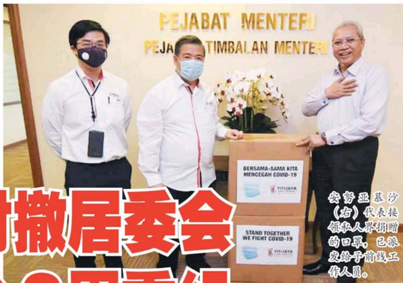
安努亚慕沙(右)代表接领私人界捐赠的口罩,已派发给前线工作人员。

吉隆坡26日讯 | 联邦直辖区部宣布终止2019/2020年居民代表委员会(MPP)的职务撤反弹! 联邦直辖区部长丹斯里安努亚慕沙承诺两个星期内重组并成立新的居委会, 惟10名希盟及民兴党国会议员担忧此举将影响社区服务的工作, 并促部长收回成命。