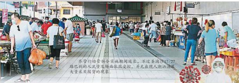
尽管行动管制令实施期间延长,不过圣淘沙17/27路巴刹的人流量及场面依然受控,并无出现人潮汹涌及大量采买囤货的现象