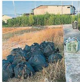
垃圾载走的时间才有回收，还需动用两辆罗里才能将新沟渔村2月份展开的大扫除，需要3天。

(巴生26日讯)防冠病、防A型流感，别忘了防骨痛热症！ 冠状病毒病自爆发后引起人心惶惶，第一时间到超市或药行抢购口罩和消毒品，却忽略困扰多年的骨痛热症。 根据卫生部的iDENGUE网站显示，从去年12月29日至今年3月22日为止，全国的骨痛热症病例共累积3万3141宗，而本月22日单日就有190宗。 其中，雪州的骨痛热症病例一直都是高居榜首，州内在上述日期就累积了2万379宗病例，单是22日一天就有109病例。