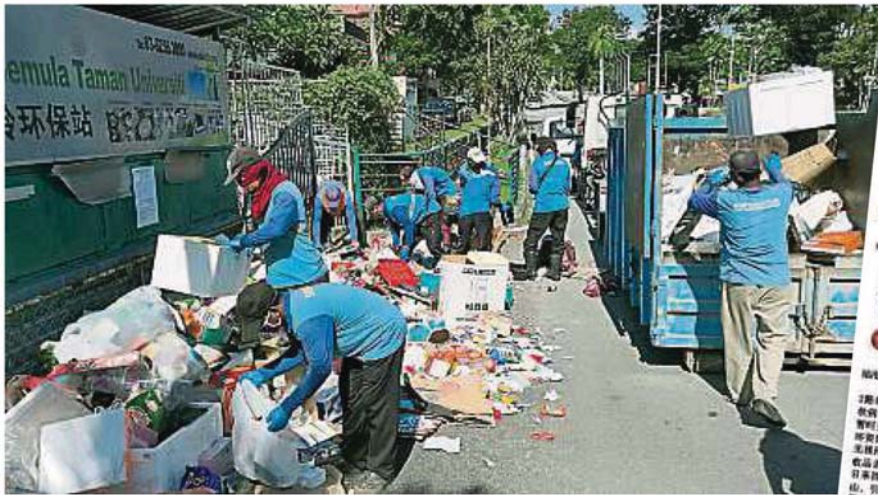
清洁工人分工合作清理环保站门外堆积如山的垃圾。

Provided for client's internal research purposes only. May not be further copied, distributed, sold or published in any form without the prior consent of the copyright owner.