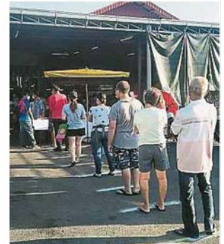
為了管制人流，巴刹小販公會實施領牌制，民眾必須分批輪流進入巴刹買菜。

他表示，湖景公園人流最多，疫情未爆發之前，每天逾百人到公園活動，公共設施必須消毒，以防疫情傳播。