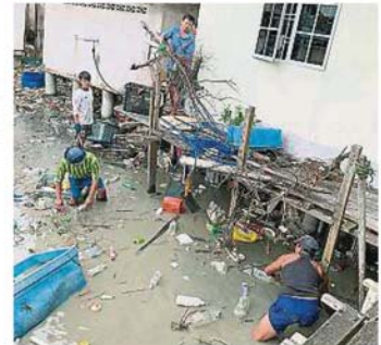
村民们不分你我，一起将垃圾搭起来，为家园尽一分力。