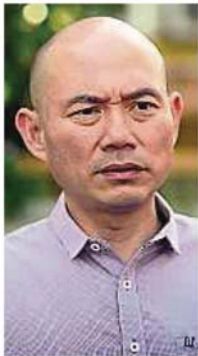
林立迎炮轰 联邦直辖区部在各造积极抗疫期间，终止居民代表委员会的职务是浪费资源，并促联邦直辖区马华给予交代。

(八打灵再也26日讯) 正当大马面对冠病疫情肆虐而大众纷纷防疫之际，联邦直辖区部突然发出正式信函，终止各国会选区居民代表委员会 (MPP) 的任期，引起希盟国会议员反弹。