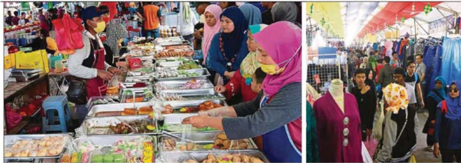
Varieties of traditional kuih is a sight to behold every Ramadan. (Right) Large group of shoppers at the Jalan Raja bazaar in Kuala Lumpur last year.