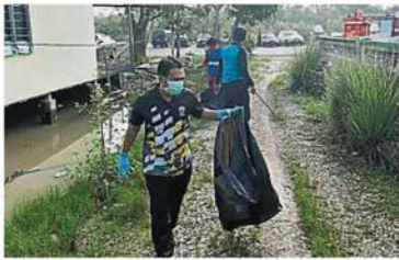
只要每个人都愿意献力，渔村的卫生问题就可以获得改善。

(巴生26日讯)防冠病、防A型流感，别忘了防骨痛热症！ 冠状病毒病自爆发后引起人心惶惶，第一时间到超市或药行抢购口罩和消毒品，却忽略困扰多年的骨痛热症。 根据卫生部的iDENGUE网站显示，从去年12月29日至今年3月22日为止，全国的骨痛热症病例共累积3万3141宗，而本月22日单日就有190宗。 其中，雪州的骨痛热症病例一直都是高居榜首，州内在上述日期就累积了2万379宗病例，单是22日一天就有109病例。