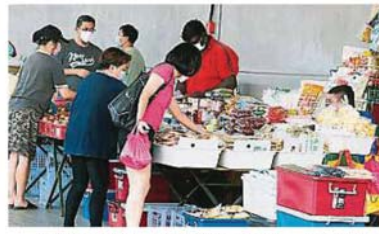
小販及民眾指出, 因家中食材尚且充足, 目前大家仍是適量採買食材。

他們也說, 與蔬菜及肉類食品相比, 干糧較容易儲藏, 因此民眾一般會到超市選購糧食來囤積。