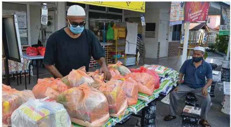
AJK Masjid Al Sultan Abdullah menyusun makanan untuk disumbangkan kepada asnaf dan mereka yang terputus bekalan di pekarangan Masjid Al-Sultan Abdullah di pekan Masjid Tanah, semalam.

"Saya bukan penerima zakat, tetapi kini amat memerlukan bantuan kewangan bagi membayar