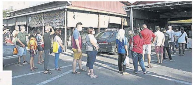
为了买食材, 即使晒也得耐心排队等候。