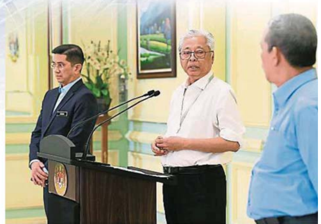
依斯邁（中）說，政府有必要制定更嚴格的行管令，以確保有效遏止冠病擴散。左為國際貿易及工業部長的拿督斯里阿茲敏阿里；右為工程部長拿督斯里法迪拉。

他表示，目前一些州屬的防疫标准程序與聯邦政府制定的标准有別，因此今天的會議也議決，讓每個州屬有一名內閣部長成為州級國家安全理事會的成員，以便能傳達聯邦政府的資訊或決定給州安理會，協調抗疫行動。