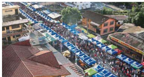
Some local councils have already issued trading permits for Ramadan bazaars.

"But we have to wait for the decision from the top management," he said.