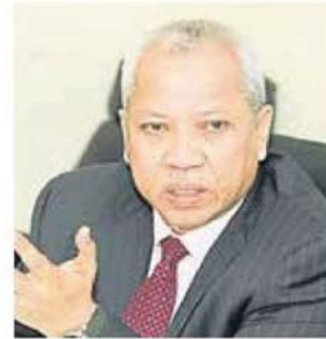
■安努亚慕沙指示终止所有居民代表委员会的职务。

因此，所有国会议员呼吁安努亚慕沙三思，任何政策需以民为先，促请他不要终止现有居民代表委员会的职务。