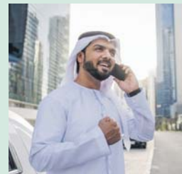
ALLAH SWT memberi kesenangan dan kesesuaian untuk menguji sama ada hamba-NYA mengingati-NYA ataupun sebaliknya.

Sumber: Pensyarah Kanan Jabatan al-Quran dan Sunnah, Fakulti Pengajian dan Peradaban Islam, Kolej Universiti Islam Antarabangsa Selangor, Dr Mohd Farid Ravi Abdullah