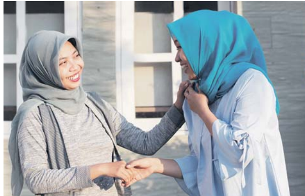
BERBUAT baiklah dan bantu orang yang berhampiran dengan kita jika mereka memerlukan pertolongan.

Mengakhiri perkongsian ilmunya, beliau berkata, sabar itu besar pahalanya. "Akan tetapi, sabar itu hanyalah untuk diri sendiri. Tapi, kekayaan yang disyukuri oleh seseorang adalah untuk dia dan masyarakat," katanya.