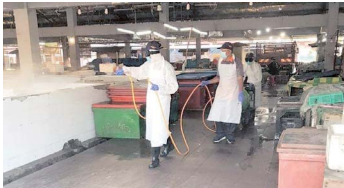
Anggota MDKS melakukan semburan disinfeksi Covid-19 di sebuah pasar awam di Kuala Selangor kelmarin.