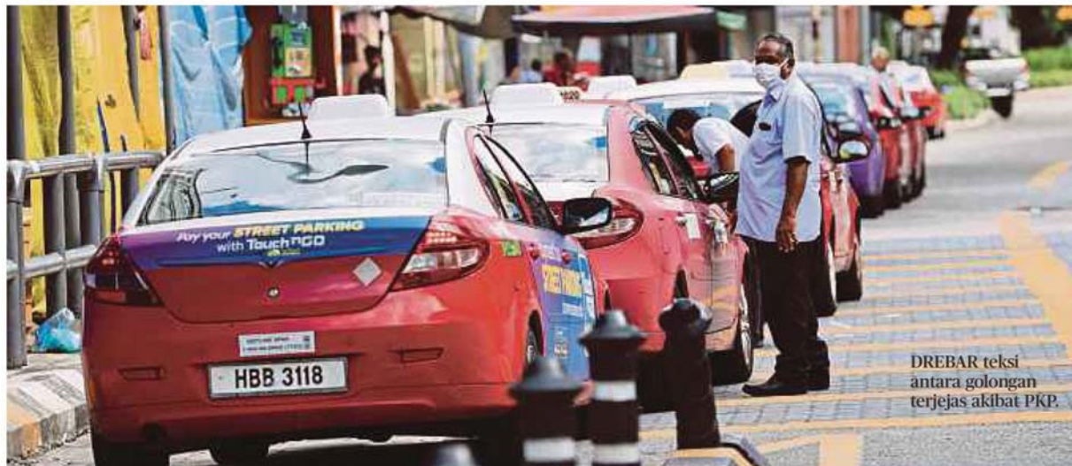
DREBAR teks antara golongan terjejas akibat PKP.